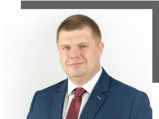
Wojciech Kałuża Wicemarszałek Województwa Śląskiego

– Aby zachować konkurencyjność, pracodawcy powinni inwestować w pracowników, pozwalając im podnosić kwalifikacje. Tylko w ten sposób będą bardziej efektywni. W naszym regio-