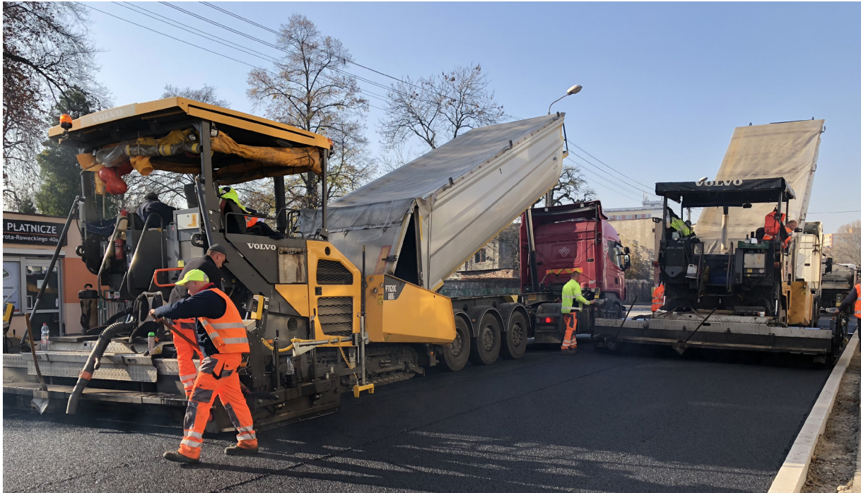
Silesia Invest Sp. z o.o. Sp. k. opracowała ekologiczną mieszankę do wypełniania nawierzchni dróg.