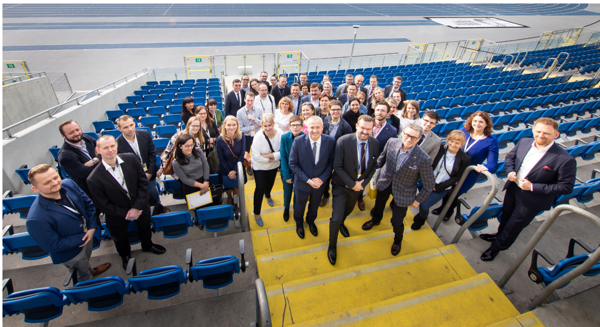
Stadion Śląski gościł ponad stu uczestników konferencji.