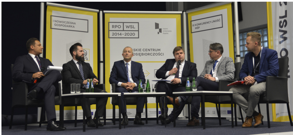
Konferencja była okazją do rozmów o przyszłości regionu w kontekście budowania gospodarki opartej o Fundusze Europejskie.