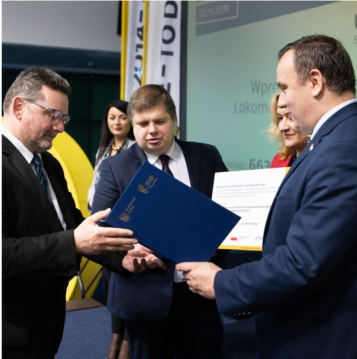
W trakcie spotkania przedsiębiorcy odebrali umowy na dofinansowanie przedsięwzięć w ramach RPO WSL 2014-2020.